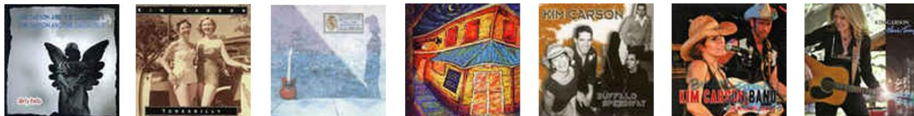
Dirty Halo-1997-Tonkabilly-1998-Calle de Orleans-2001-Live At Tipitina's-2004-Buffalo-Speedway-2005-Live In Freiburg-2008-Classic wang 2010